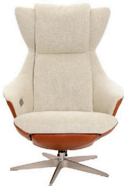
Afgebeeld Model ARC