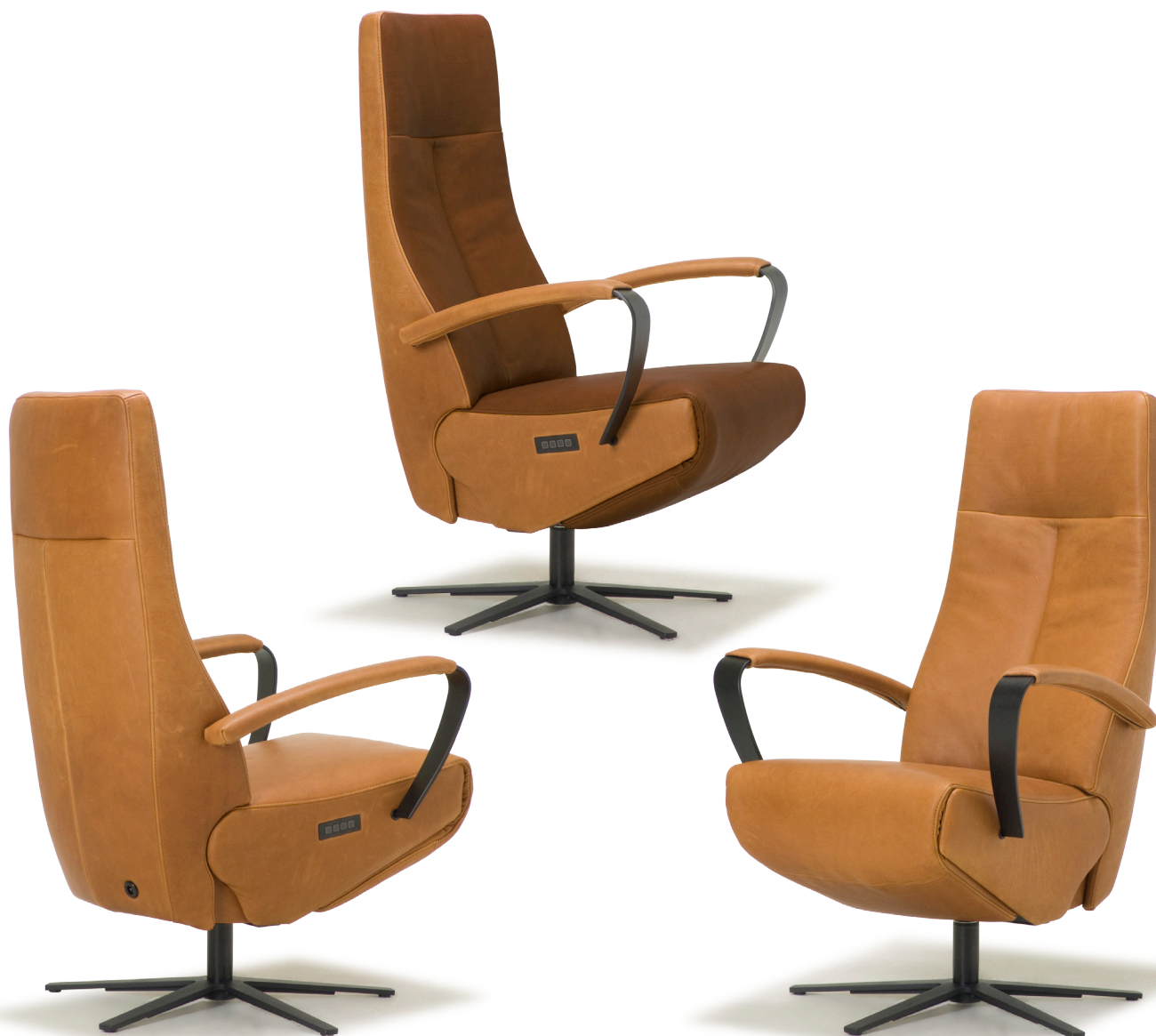
Afgebeeld: Timon met voet 87

Fauteuil Timon kan voorzien worden van verwarming. Hiervoor dient de fauteuil wel aangesloten te zijn op een stopcontact.