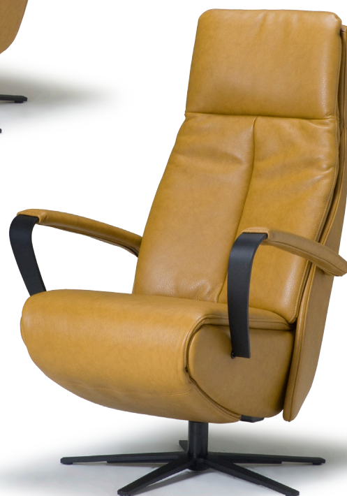
Afgebeeld: Tyler hoog met voet 87