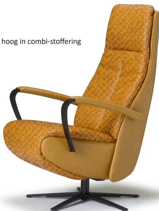
Afgebeeld: Tyler hoog in combi-stoffering

Fauteuil Tyler kan voorzien worden van verwarming. Hiervoor dient de fauteuil wel aangesloten te zijn op een stopcontact.